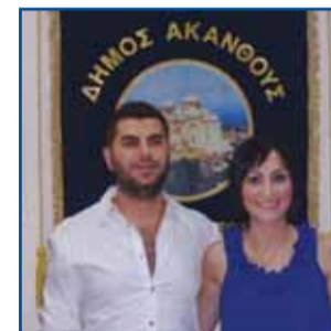
Πολιτικός γάμος Ακανθιώτη σελ. 3