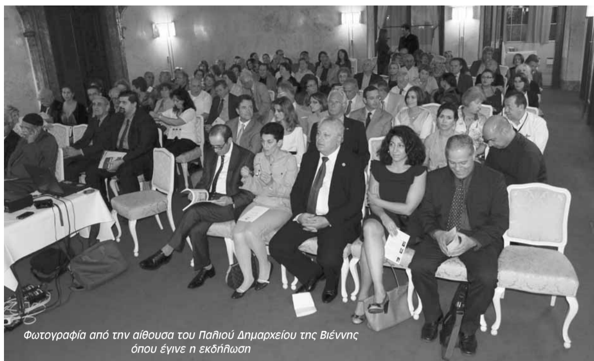
Φωτογραφία από την αίθουσα του Παλιού Δημαρχείου της Βιέννης όπου έγινε η εκδήλωση

Η κυπριακή πολιτιστική κληρονομιά και η καταστροφή της στην κατεχόμενη Κύπρο, ήταν το θέμα μεγάλης εκδήλωσης που πραγματοποιήθηκε την Πέμπτη 6 Οκτωβρίου 2011 στις αίθουσες του παλιού Δημαρχείου Βιέννης, η οποία περιλάμβανε παρουσίαση βιβλίου, προβολή ντοκιμαντέρ, έκθεση φωτογραφίας και πρόγραμμα κλασικής και παραδοσιακής μουσικής. Την όλη διοργάνωση ανέλαβε το Κυπριακό Πολιτιστικό Κέντρο Βιέννης.