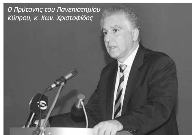
Ο Πρύτανης του Πανεπιστημίου Κύπρου, κ. Κων. Χριστοφίδης

άλλους φορείς στους οποίους πρέπει να υπάρχει μια συνεχής ενημέρωση για το Εθνικό μας θέμα και ειδικότερα για την καταστροφή ενός Ευρωπαϊκού πολιτισμού που βρίσκεται στο κατεχόμενο μέρος της Κύπρου.