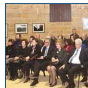
Αντικατοχική εκδήλωση κατεχόμενων δήμων σελ. 4