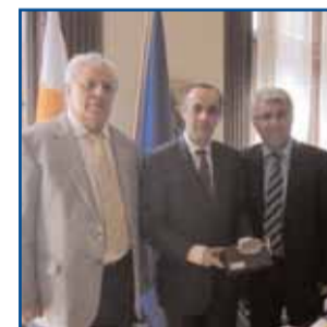
Οι κατεχόμενοι δήμοι στη Βιέννη σελ.5

Το νεοεκλεγέν Δημοτικό Συμβούλιο κατά την ημέρα της ανακήρυξής του, στο Πολιτιστικό Κέντρο του Δήμου Αμμοχώστου στη Δερύνεια.