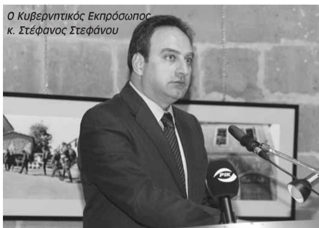
Ο Κυβερνητικός Εκπρόσωπος κ. Στέφανος Στεφάνου