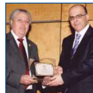
Εκδήλωση για την Ημέρα Γραμμάτων σελ.8